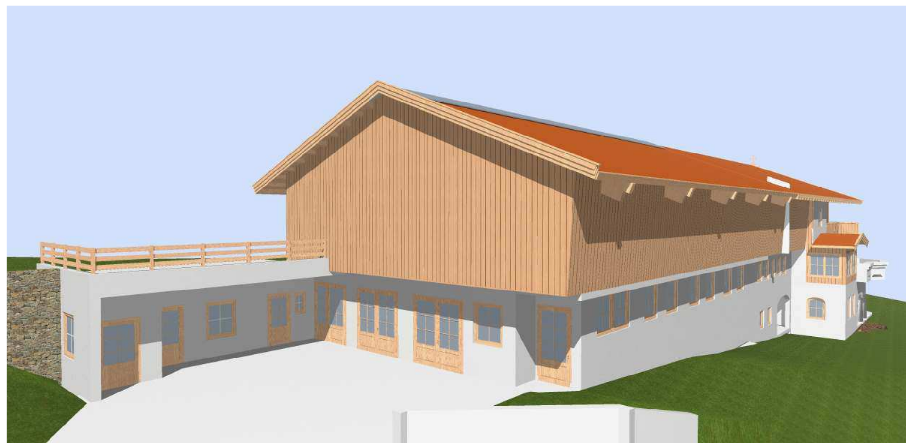
Zubau eines Laufstalles Schnitt (M 1:125) 3D Ansicht